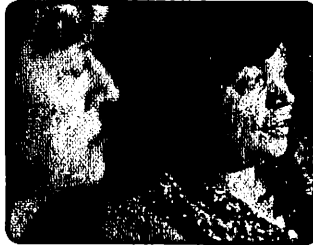
— Ils ont de meilleurs vêtements aussi.

Briefly review the meanings of these four verbs.