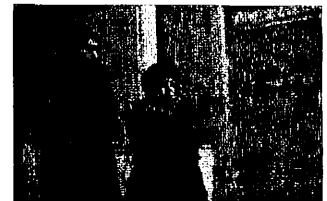
Ils ont froid.