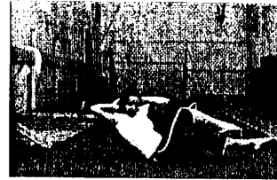
Elle fait de l'exercice.